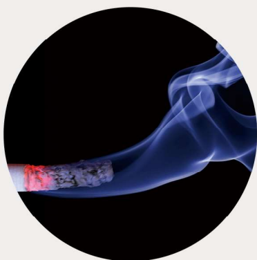
Rauch & Feinststaub