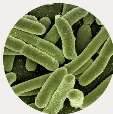
Bakterien & Viren*