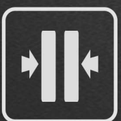
Zwei Wege Ventilation